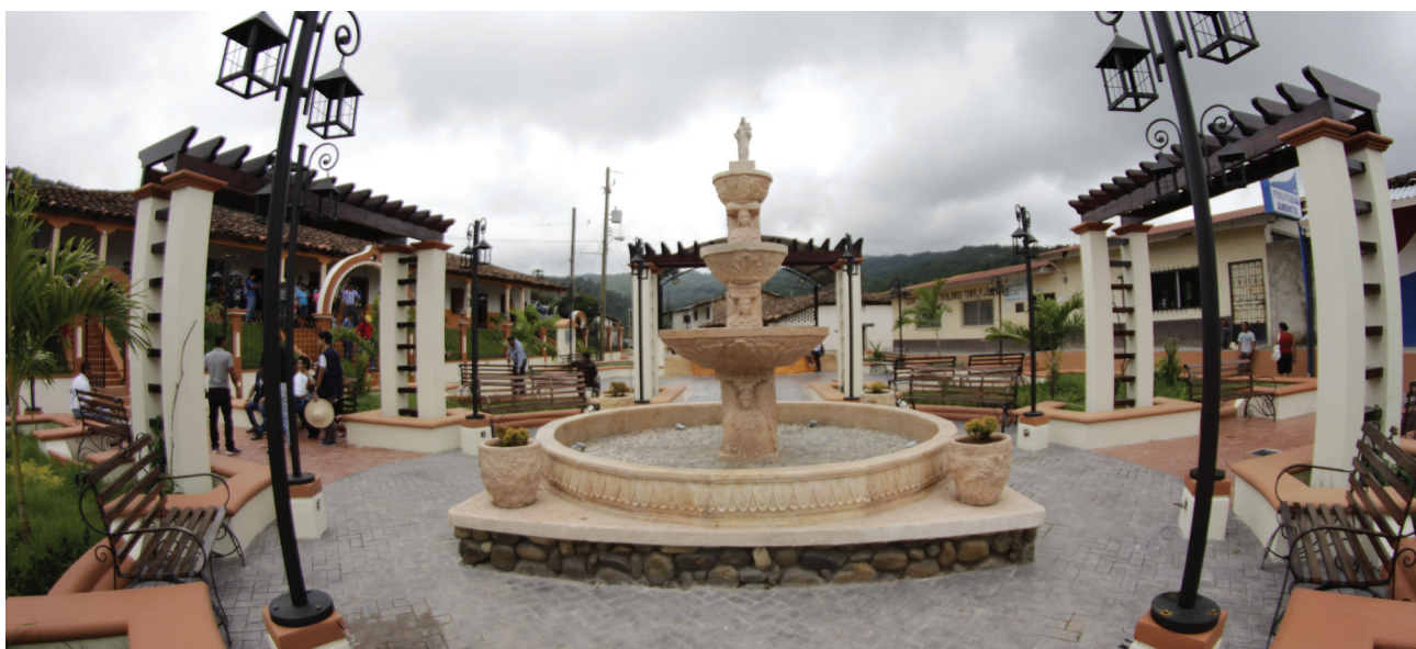
Parque Central del Municipio de Tomalá, Lempira. Construido por el Programa USAID|NEXOS.