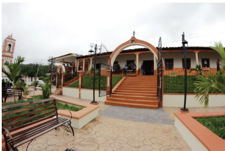
Municipalidad de Tomalá, Lempira.

Diversos ordenamientos regulan la rendición de cuentas de los gobiernos municipales, muchos de ellos creados para fiscalizar y regular el uso y destino de los fondos transferidos a las municipalidades. La Constitución de la República establece los lineamientos generales con que se orienta el ejercicio de los recursos del Estado y se complementa con otras leyes y reglamentaciones municipales.